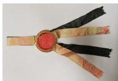
Helsingfors sadelmakaresigill: SALMAKARE ÄMBETET SIGIL. finna.fi/Helsingfors stads- museum XXXI-19.