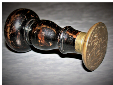
Helsingfors stads kopparsmeders sigill 1802. finna.fi/Helsingfors-stadsmuseum CCCI-18 .